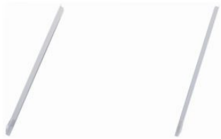
Στηρίγματα ST GN 00 ST 60 00