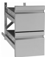
Συρτάρι 1/2+1/2 SY GN 1212 (44x55x72 cm) SY 60 1212 (44x45x72 cm)