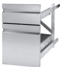
Συρτάρι 1/3+2/3 SY GN 1323 (44x55x72 cm) SY 60 1323 (44x45x72 cm)