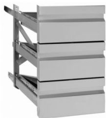
Συρτάρι 1/3+1/3+1/3 SY GN 131313 (44x55x72 cm) SY 60 131313 (44x45x72 cm)