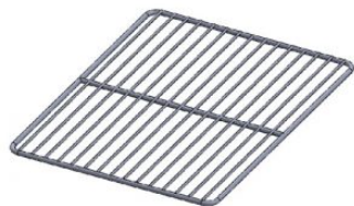
Σχάρα SX 80 00 (40x63 cm)