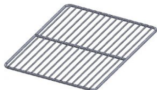
Σχάρα SX 80 00 (40x63 cm)