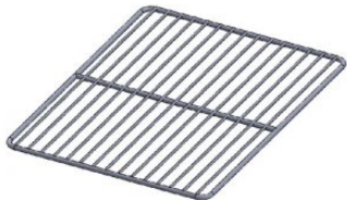
Σχάρα SX 80 00 (40x63 cm)