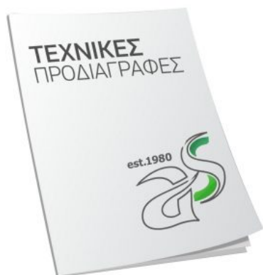
Τεχνικές Προδιαγραφές Κατεβάστε το