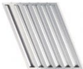
Φίλτρο FL 50 45 45 x 50 x 2,8 cm