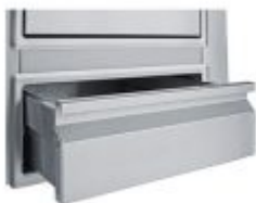
Συρτάρι SE 1 (36 x 45 x 13 cm)