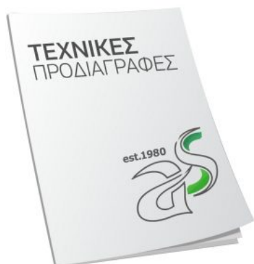
Τεχνικές Προδιαγραφές Κατεβάστε το