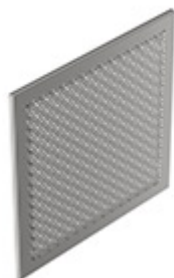
Συγκεντρωτής λίπους ΜΚCG