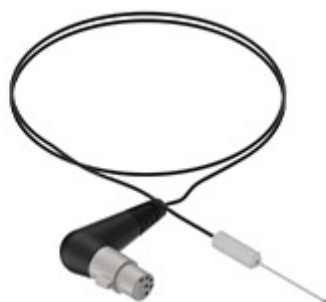
Αισθητήρας για μαγείρεμα vacuum MKSCSV