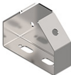
Στήριγμα για αισθητήρα MKSSC/A