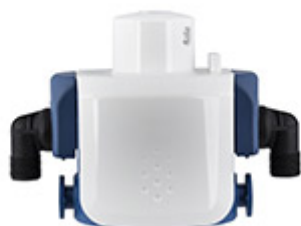
Κεφαλή φίλτρου για βελτιστοπ. νερού ΚΤΑ