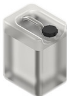
Απορρυπαντικό & Γυαλιστικό MKDET