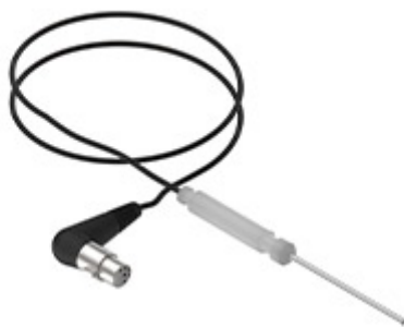
Αισθητήρας 3-σημεία MKSCMU