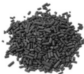
Ενεργός άνθρακας RCA