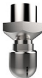
Αυτόματο σύστημα πλύσης MKWT