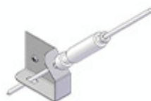
Αισθητήρας θερμ/σίας με βάση EKSCS